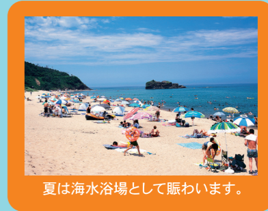
夏は海水浴場として賑わいます。

美しい自然を守るため、石や植物は観察するだけにしましょう。危険な場所や立ち入り禁止の場所には入らないようにしてください。持って帰るのは楽しい思い出と写真、そして地元のおみやげ!!