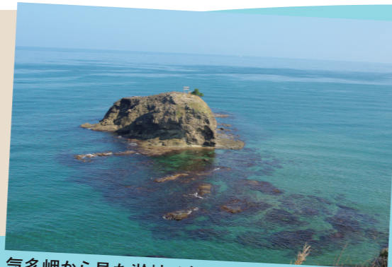
気多岬から見た淤岐ノ島

兎がいたとされる淤岐ノ島の北側と南側には波食棚が見られます。波食棚は干潮時に海面上にあらわれ、鮫(わにざめ)の背中のように見えます。兎がいたとされる島は諸説ありますが、神話と自然の景観を重ね合わせて眺めるとよいでしょう。