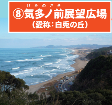
気多ノ前展望広場から見た海岸線

美しい自然を守るため、石や植物は観察するだけにしましょう。危険な場所や立ち入り禁止の場所には入らないようにしてください。持って帰るのは楽しい思い出と写真、そして地元のおみやげ!!