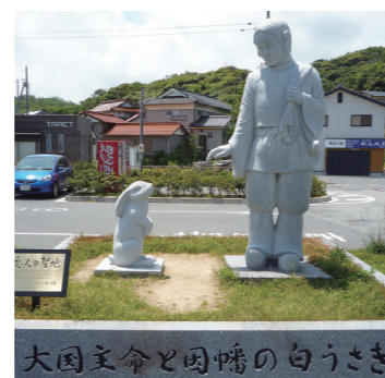
神話「因幡の白うさぎ」の石像

広く知られている話はここまでです。神話の舞台は諸説あり、「淤岐ノ島」は、沖合にある島、あるいは島根県の「隠岐島」という説もあります。