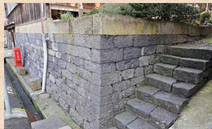
玄武岩の石積みと階段(立野)

豊岡の家や蔵の基礎石、石垣には、かつて玄武洞で採れた玄武岩がよく使われています。海面と地面の高さがほとんど同じ豊岡は洪水が多く、床の高さを高くする必要がありました。そこで、頑丈で重い玄武岩を利用しました。これは、近くに玄武洞がある豊岡ならではの光景です。