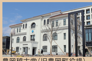
豊岡稽古堂(旧豊岡町役場)

豊岡の家や蔵の基礎石、石垣には、かつて玄武洞で採れた玄武岩がよく使われています。海面と地面の高さがほとんど同じ豊岡は洪水が多く、床の高さを高くする必要がありました。そこで、頑丈で重い玄武岩を利用しました。これは、近くに玄武洞がある豊岡ならではの光景です。