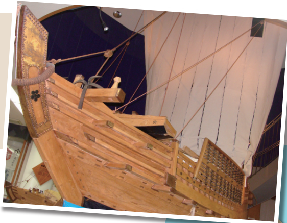
北前船(復元模型:北前館)

北前船(きたまえぶね)は、江戸時代から明治時代にかけて日本海沿岸諸港から瀬戸内海を結ぶ航路を行きかっており、竹野は寄港地として栄え賑わいました。船主は一度の航海で莫大な富を得ることができましたが、一度難破すればすべてを失うという大きなリスクも負っていました。