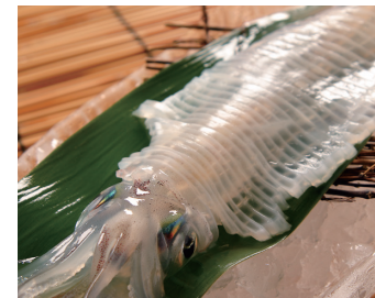
鮮度が決め手!活イカの刺身!