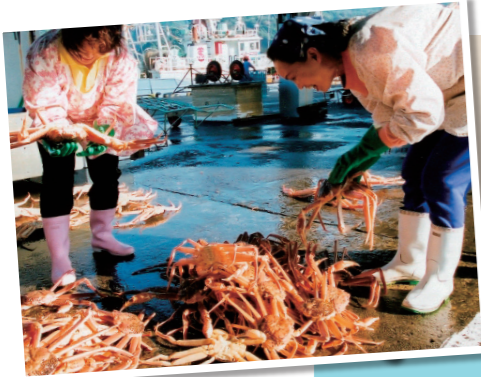
カニの水揚げ風景

日本海沿岸の漁村として古くから発展してきた香住。漁港には日本海の幸が連日水揚げされています。このコースでは、活気あふれる漁港や昔の面影が残る街並み、日本海が作った雄大な風景をめぐることができます。