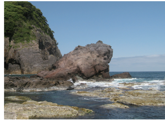
今子浦のかえる島