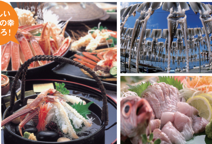
松葉ガニや香住ガニ