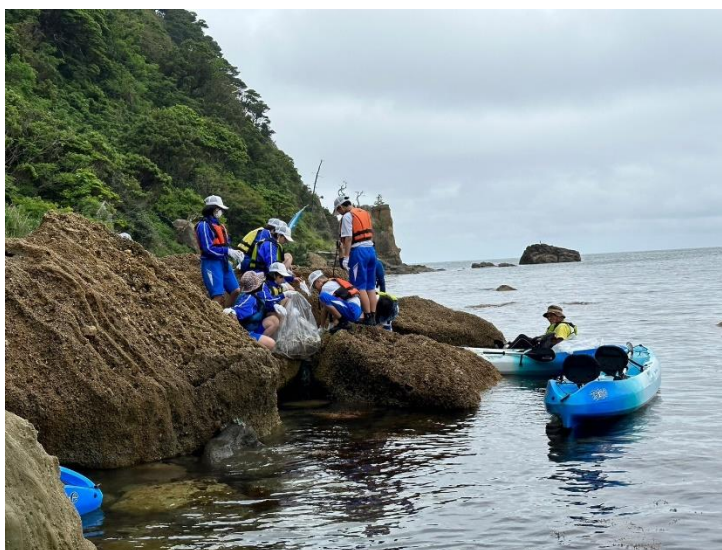
清掃活動の様子（豊岡市竹野）