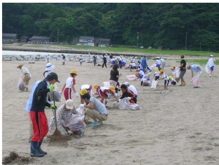
清掃活動の様子（豊岡市気比の浜）