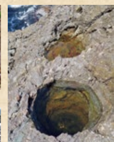
甌穴（ポットホール）