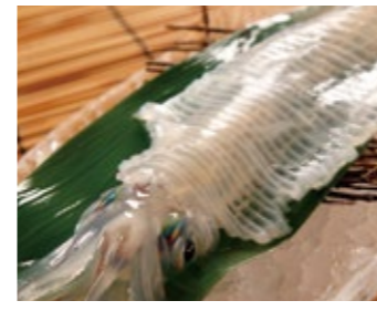
鮮度が決め手!活イカの刺身!