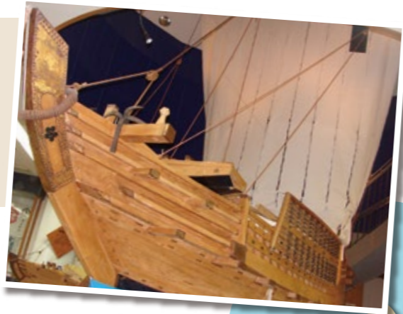
北前船(復元模型:北前館)

北前船(きたまえぶね)は、江戸時代から明治時代にかけて日本海沿岸諸港から瀬戸内海を結ぶ航路を行きかっており、竹野は寄港地として栄え賑わいました。船主は一度の航海で莫大な富を得ることができましたが、一度難破すればすべてを失うという大きなリスクも負っていました。