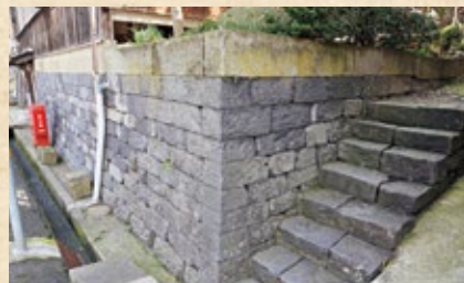
玄武岩做成的石砌和階梯(立野)

豐岡的房子和存放穀物的倉庫，地基很多使用了玄武岩，海拔高度是零的豐岡市常常遇到洪水侵擾，建造住房時需要抬高地基，因此又重又結實的玄武岩受到了青睞。正是因為附近的玄武洞才有了豐岡獨特的風景。