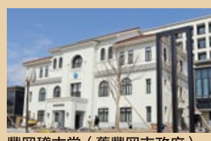
豐岡稽古堂(舊豐岡市政府)

豐岡的房子和存放穀物的倉庫，地基很多使用了玄武岩，海拔高度是零的豐岡市常常遇到洪水侵擾，建造住房時需要抬高地基，因此又重又結實的玄武岩受到了青睞。正是因為附近的玄武洞才有了豐岡獨特的風景。