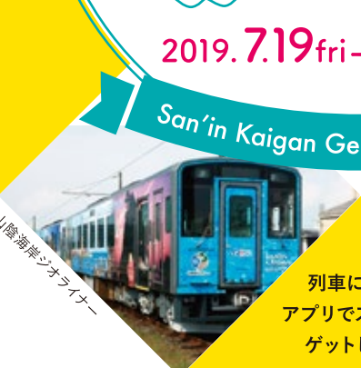
山陰海岸ジオライナー