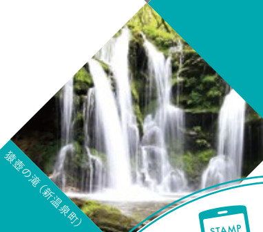
猿座の滝 (新温泉町)