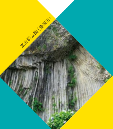
支武洞公園 (豊岡市)