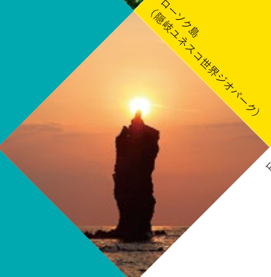
ローンク島 (隠岐ユネスコ世界ジオパーク)