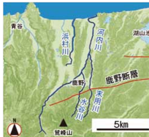
鹿野断層の位置(一部推定)