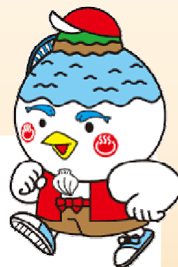
湖山池マスコット「こいけちゃん」

※コース周辺地図は裏面をごらん下さい。 ※ハーフゴール地点からスタート地点に戻る無料シャトルバスを運行します。