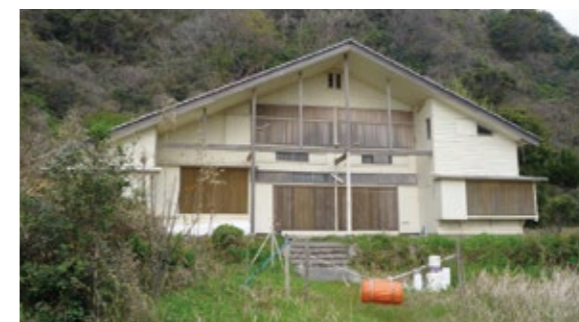
思い出を秘める鷗鳴荘

熊井浜の中央には、鷗鳴荘(おうめいそう)という建物があります。これは、岩美町出身の国連大使の澤田廉三氏の別荘跡です。ここでは、夫人の美喜さんが設立したエリザベスサンダースホーム(児童福祉施設)の子どもたちが、毎年夏に訪れて海水浴を楽しみました。子どもたちにとっては思い出の多い浜です。