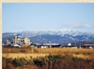
鳥取市から見た扇ノ山

扇ノ山火山は約120万年前から40万年前にかけて活動した、小さな火山の集合した火山群です。扇ノ山火山の活動は3期に分けられており、それぞれ安山岩や玄武岩質の溶岩を流しました。これらの溶岩が河合谷高原や上山高原などの平坦な地形を作っています。活動の後期には、火山噴出物が火口付近に降り積もり小さな高まりを作りました。兵庫県側の上山(946m)やジオパークのエリア外ですが、広留野の小丘(930m)がそれで、扇ノ山山頂の北側の稜線にある大ズッコ(1,309m)や小ズッコ(1,089m)と呼ばれる高まりも同様のものだと考えられています。