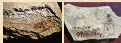
トットリムカンギンボの化石 (鳥取県立博物館)

扇ノ山北麓周辺は化石の産地として知られています。鳥取県側ではたくさんの魚類化石が産出し、兵庫県側では多くの昆虫化石が産出しています。これらの化石の種類や地層を調べることで、浅い海であった時代や、湖があった時代があることがわかります。これらの化石は、「鳥取県立博物館」、「山陰海岸ジオパーク海と大地の自然館」「おもしろ昆虫化石館」で見ることができます。