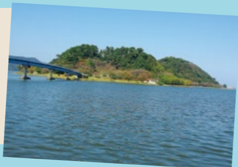
湖山池に浮かぶ青島

湖山池には現在5つの島があります。その中で、最大の島が青島です。島の周囲には遊歩道があり、たくさんの桜の木が植えられています。また、展望台からは、湖山砂丘と日本海を望むことができ、かつて内湾であったことがうなづけます。