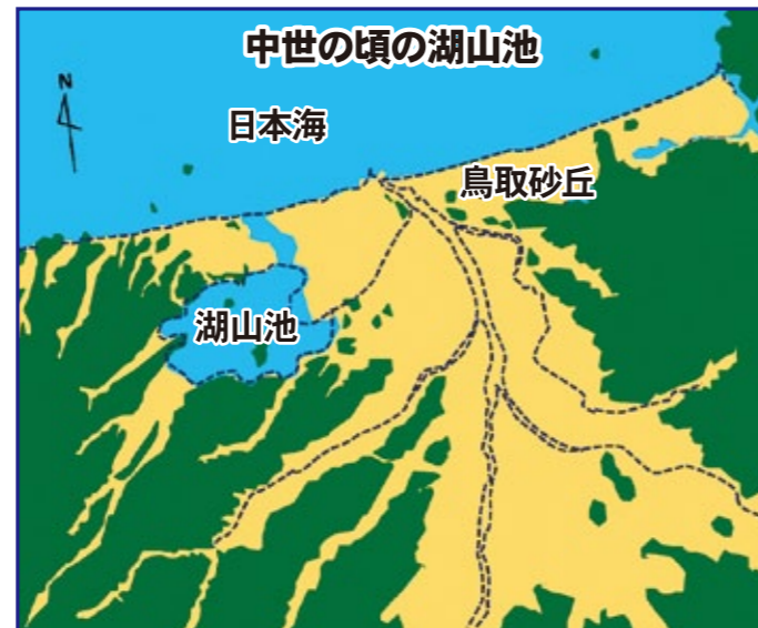
■:水域 ■:山地 ■:河川および平野

その後、地球の寒冷化により海面が低下し、海岸線がはるか沖に後退しますが、約6千年前の縄文時代には地球が温暖化して海水面が上昇し、再び内湾になりました。この内湾は引き続き堆積によって湖山池付近を残して干上がり鳥取平野が形成されました。湖山池は中世頃までは日本海とつながっていましたが、湖山砂丘の成長でつながりが絶たれ現在のような姿になりました。