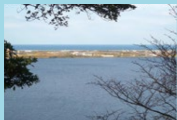
青島展望台から見た日本海