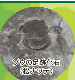
ソウの足跡化石(松ナワテ)

潮だまりには多くの海岸生物がみられます。さて、潮だまりとなっている大きな丸い穴はどうしてできたのでしょうか?