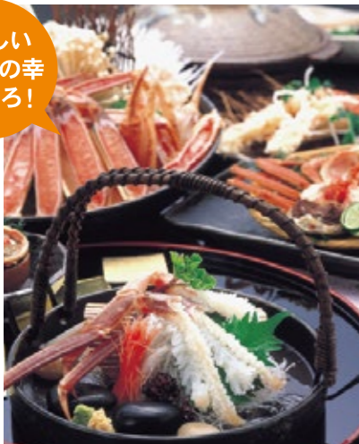
松葉ガニや香住ガニ