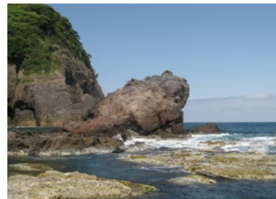
今子浦のかえる島