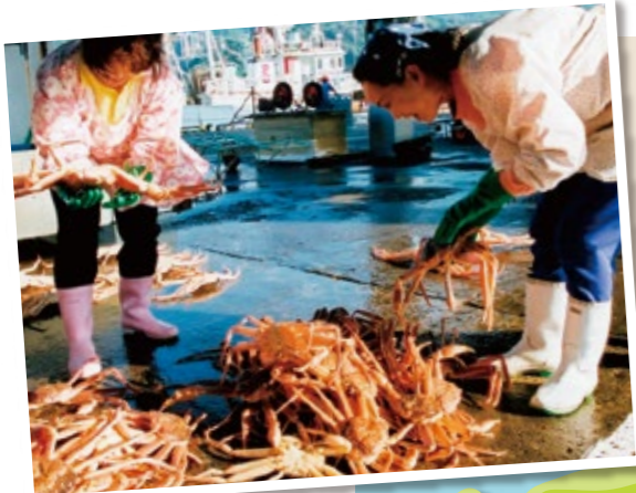
カニの水揚げ風景

日本海沿岸の漁村として古くから発展してきた香住。漁港には日本海の幸が連日水揚げされています。このコースでは、活気あふれる漁港や昔の面影が残る街並み、日本海が作った雄大な風景をめぐることができます。