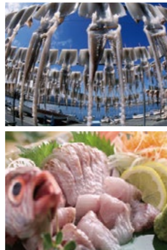
(上)イカの干物(下)ノドグロ