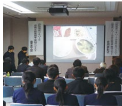
山陰海岸ジオパーク中高生政策提案・実践コンテスト