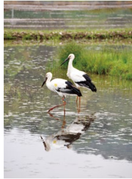
コウノトリの保護活動