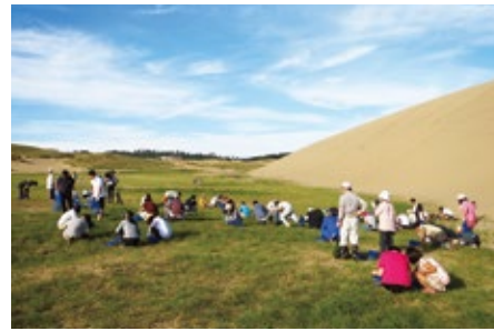
砂丘での除草活動