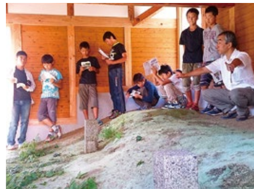
小学生向け学習会