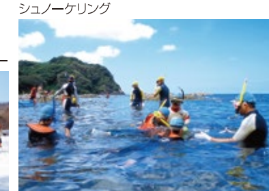
シュノーケリング