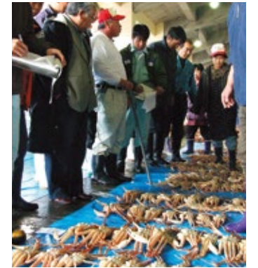
山陰沖で水揚げされるカニの競り