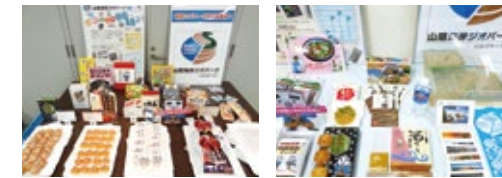
山陰海岸ジオパーク ロゴマーク認定商品