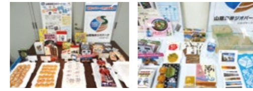
산인 해안 지오파크 로고마크 인증 상품