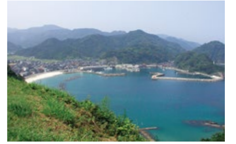
리아스 해안을 이용한 바람을 기다리는 항구