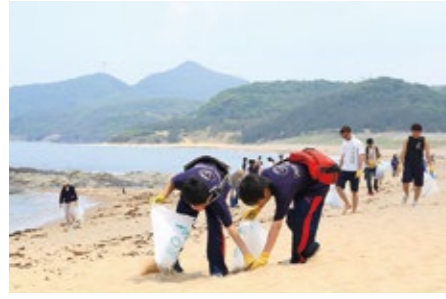
해변 청소 활동