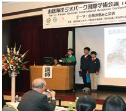
산인 해안 지오파크 국제 학술회의