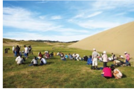
사구 제초 활동