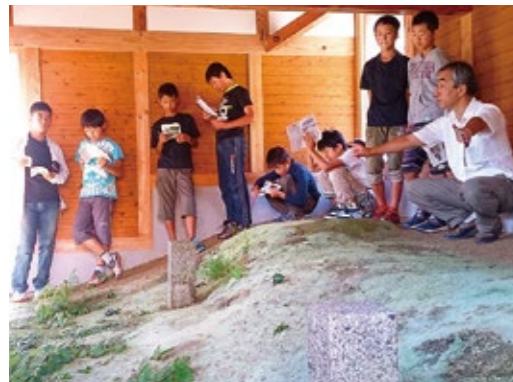
초등학생을 위한 학습회