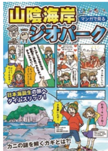
어린이를 위한 만화 팸플릿