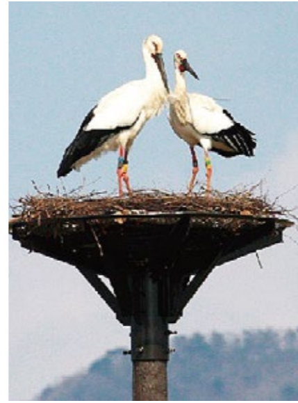
황새 보호 활동