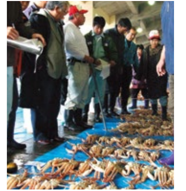
산인 바다에서 잡은 게 경매