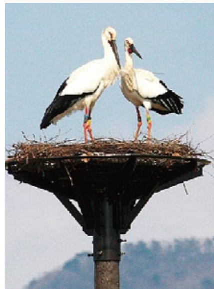
保护东方白鹳活动