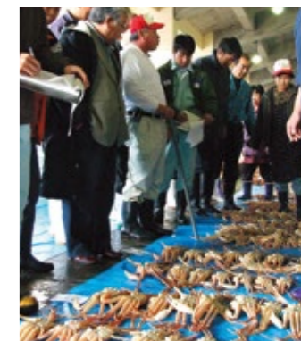
在山阴近海捕捞的海蟹的拍卖情景