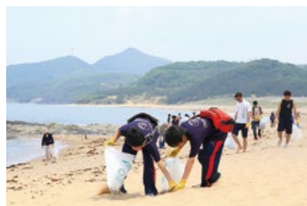
海滩卫生清扫活动