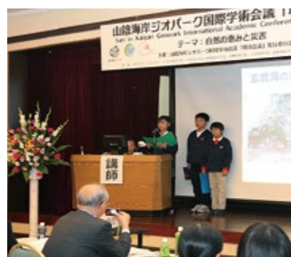
山阴海岸地质公园国际学术会议