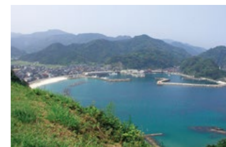
利用里亚式海岸形成的待风港