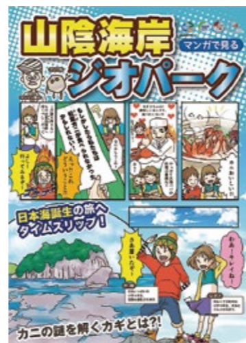
面向儿童的漫画宣传册