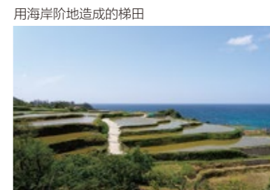
用海岸阶地造成的梯田