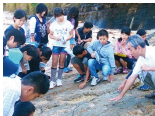
面向小学生的学习会