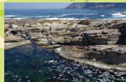
五色浜園地の前に広がる波食棚

少し足をのびして ~塩江海岸から五色浜園地へ~ 近畿自然歩道で塩江~五色浜まで片道1.7km・45分