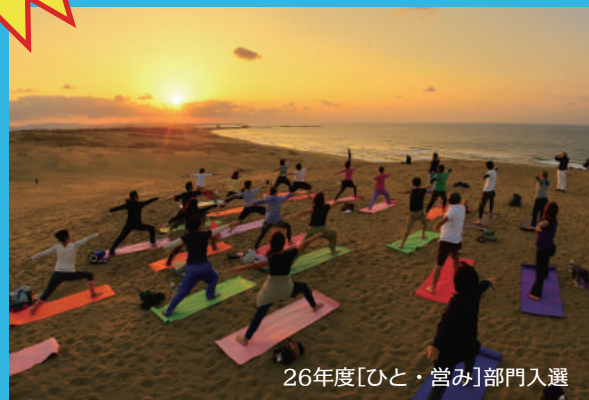
26年度[ひと・営み]部門入選