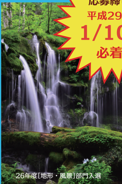
26年度[地形・風景]部門入選