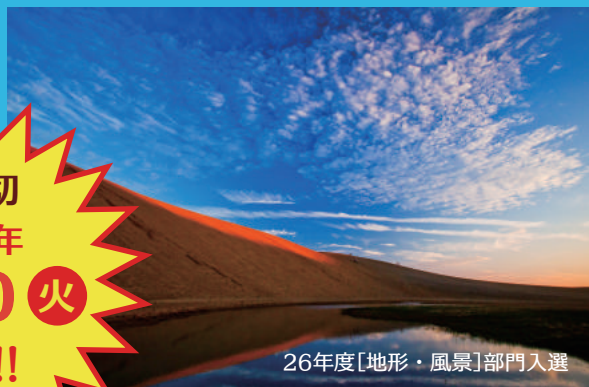
26年度[地形・風景]部門入選